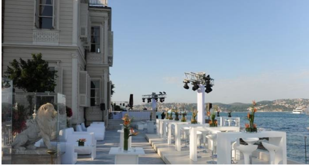
Fotoğraf 4: Günümüzde Sait Halim Paşa Yalısı

atlanmamalıdır. Barok öğeler, sadece Nuruosmaniye Camii gibi kamusal mekanlarda değil, dönemin yalılarında da kendilerini belli etmekteydi. Burada dikkat edilmesi gereken unsur, Batı kaynaklı tüm bu mimari öğelerin, geniş Osmanlı coğrafyasında ustalar tarafından inşa edilegelen geleneksel konutlara bulaşamamış olmalarına rağmen, Batılı eğitim ve kentleşmeden etkilenen küçük ama nüfuzlu bir zümre tarafından Osmanlı başkentine taşındıklarıdır (Civelek, 2003: 32-38). Örneğin Yeniköy'de yer alan Sait Halim Paşa Yalısı'nda ortaya koyulan eklektik yaklaşım da bu açıdan ele alınabilir. Yurtdışında gördüğü eğitimin ve Osmanlı'da aldığı üst düzey görevlerin etkileriyle, anavatani olan Mısır'ın ve yaşadığı Osmanlı İstanbul'unun etkilerinin bir araya gelmesi sonucunda Sait Halim Paşa, çeşitli mimari akımları aynı anda barındıran böyle bir yalı projesi gerçekleştirmiştir. Ancak kendisi, 1995'te geçirdiği yangından sonra restore edilerek yeni bir kullanım kazanan yalısının aksine hayata tutunamamış ve 1921'de Roma'da uğradığı silahlı saldırı sonucu hayatını kaybetmiştir. Bu ölüm bir devrin sonuna işaret etse de, günümüze ulaşan yalı ile birlikte ele alındığında, değişimi anlamlandırmak adına etkileyici bir alegori oluşturmaktadır.