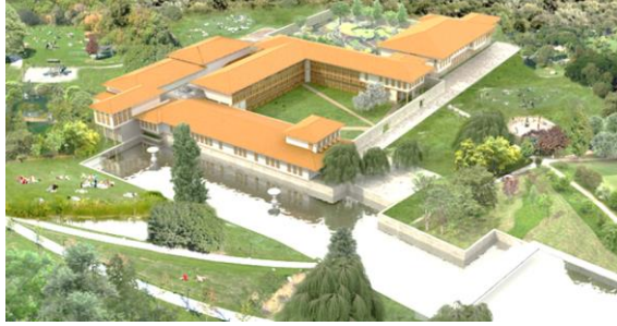
Fotoğraf 1: Sadabad Sarayı 3 Boyutlu Modelleme Çalışması (PATTU Mimarlık, 2010)

Modern tarihçilikte Lale Devri (1718-1730) olarak adlandırılan ve Patrona Halil İsyanıyla sona eren dönem ve sonrasında yaşanan gelişmeler bu duruma iyi bir örnek teşkil etmektedir. Lale Devri’nde, Batıyı daha iyi anlayabilmek için Avrupa’ya elçiler yollanmış, sanata büyük önem verilmiş, büyük imar projelerine girilmiş ve ilk defa kağıt fabrikası ve matbaa kurulmuştur. İsyanla son bulan bu dönemi takiben tahta geçen I. Mahmut ise, önce isyancıları derdest etmeyi başarmış, ardından da Beylerbeyi’nden Kağıthane’ye kadar, şehrin klasik sınırları dışında kalan geniş bir alana yayılmış ve isyancılar tarafından yakılıp yıkılmış pek çok köşk, kasır ve sarayı onartmış, daha pek çok benzer yapıyı aynı geniş coğrafyada hayata geçirmiş ve pratikte Lale Devri anlayışını devam ettirmiştir (Arslan, 2014: 97-117).