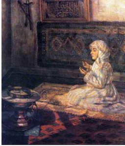
Resim 2.9: Müfide Kadri. "Dua Eden Kız", 1912

1912 tarihli "Dua Eden Kız" isimli eserinin, sanatçının ölmeden önce yaptığı son çalışmalarından biri olduğu düşünülür. Mekân içerisinde betimlediği kadın figürleri son Osmanlı Devleti döneminin kıyafet ve ev yaşamı hakkında bilgiler vermektedir. Kompozisyonda işlemeli seccadesinin üzerinde namaz kıyafetleriyle, gözleri kapalı, elleri havada dua eden bir kadın figürü resmin ana temasını oluşturmaktadır. Oryantalist ressamların sıklıkla kullandıkları enteriyör (oda resmi/odalık) resmi olarak nitelendirebileceğimiz eser, dönemin yaşam biçimini yansıtır.