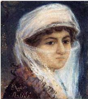
Resim 2.13.: Müfide Kadri, "Otoportre", 12x9 cm

O yılların belirgin özelliği romantizm, genç Müfide Kadri'nin resimleri dışında hemen hemen hiçbir kadın sanatçının işinde görülmez. Neredeyse o dönem kadın sanatçıların yapıtlarının önemli bir bölümü bir portreler galerisi oluşturur da, duygusallık güzel ya da gizemli kadınların seçiminin dışında kendini göstermez. Türk resminin o günlerden spontan fırça izlerini hiçbir zaman bir Alman sanatı gibi duygu yüklü ya da dışavurumcu olarak değerlendiremeyiz. Kadın resimlerinin de bu bağlamda genel Türk sanatından farklılık göstermediği söylenebilir de, yapıtlar çoğu sanat tarihçisinin yorumladığı kadın duygusallığı yerine serbest bir örgü ile örülmüş ferah yüzleriyle geleceğin pırlıklarını saklar (Atagök,1993 :18).