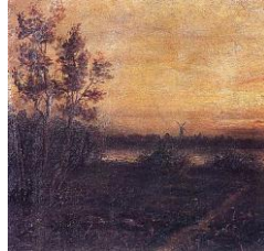
Resim 2.5.: Müfide Kadri, “Peyzaj”

Müfide Kadri'nin gündoğumu veya günbatımı manzarası temasını birçok peyzajında farklı üsluplarla tuvaline yansıttığını görürüz. Sanatçı, “Peyzaj” eserini François Millet'in resimlerini andıran gerçekçi bir tavırla çalışmıştır. Kare bir düzlem üzerinde kompozisyonunu kurgulamayı tercih eden sanatçı, gökyüzünde sarı-turuncu ve kahverengi renklerde valör uygulamalara gitmiş, yer yer empresyonist etkiler yaratmıştır. Resmin sol kısmında oldukça büyük bir alanı