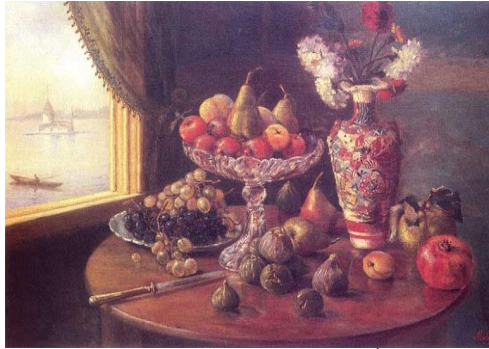
Resim 2.2.: Müfide Kadri, “Natürmort”, 53x72 cm, İzmir Resim Heykel Müzesi

beyaz, kırmızı, mavi ve sarı çiçeklerin konulduğu ince boğazlı bir vazo kompozisyonu oluşturur. Masanın üzerinde ayva, nar, kayısı, armutlar ve inciler, tabaktan dışarıya taşmış sarı üzüm salkımı sanatçı tarafından masaya serpiştirilmiş, sanatçı tarafından ustaca kurgulanmıştır. Arka planın koyu yeşil ve kahverengi tonları kompozisyonu öne çıkarmış, solda yarım olarak gördüğümüz pencereden görülen İstanbul manzarasının flu şekilde de pastel tonlarda ele alınması çalışmanın açık koyu dengesini sağlamıştır. Şık ve işlemeli kahverengi perdeden aralanan bu sarı ahşap pencerenin manzarasının kız kulesi deniz ve kayık olmasından mekânın eski İstanbul evlerinden bir yalı olduğu izlenimine varırız.