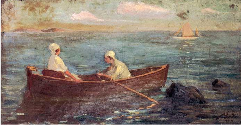
Resim 2.8: Müfide Kadri, "Kayıkta Kızlar", 1911

1912 tarihli "Dua Eden Kız" isimli eserinin, sanatçının ölmeden önce yaptığı son çalışmalarından biri olduğu düşünülür. Mekân içerisinde betimlediği kadın figürleri son Osmanlı Devleti döneminin kıyafet ve ev yaşamı hakkında bilgiler vermektedir. Kompozisyonda işlemeli seccadesinin üzerinde namaz kıyafetleriyle, gözleri kapalı, elleri havada dua eden bir kadın figürü resmin ana temasını oluşturmaktadır. Oryantalist ressamların sıklıkla kullandıkları enteriyör (oda resmi/odalık) resmi olarak nitelendirebileceğimiz eser, dönemin yaşam biçimini yansıtır.