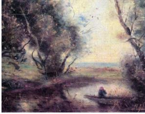
Resim 2.4.: Müfide Kadri, “Peyzaj”

Müfide Kadri'nin doğaya olan sevgisi, saraylardan parklardan çıkarak dış dünyaya açılmasına sebep olmuştur. Kadri'nin bazı peyzajlarında zaman zaman “lekeci bir anlatım” ifade dilini kullandığını görürüz. Geniş renk lekeleri kullandığı “Peyzaj” eserinde, sonbahardan kalan sarı-turuncu renklerdeki yaprakların, rüzgarın etkisinde son dirençlerini kullanarak dallara tutunduğunu hissetmek mümkündür. Kurgusal bir kompozisyon düzeni oluşturacak biçimde görülür. Kompozisyonda ağaçlar oldukça koyu lekeler halinde betimlenmişken gökyüzü neredeyse tamamen beyaz renkle kaplanmış, açık koyu dengesi netlikle sağlanmış. Uzakta belli belirsiz denizi anımsatan mavi yatay bir şerit, İki tarafındaki ağaçların yansımalarının su yüzeyine vurduğu bir dere, başında kırmızı bir şapka bulunan figürün bulunduğu eserin, dalgalı bir rüya alemine sokan akıcı ve melankolik bir etkisi vardır.