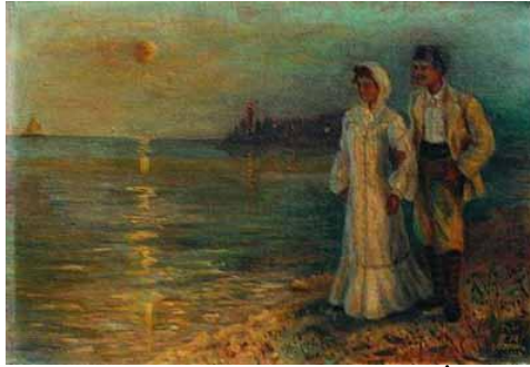
Resim 2.6.: Müfide Kadri, “Sahilde Aşk”, 1907-8., İstanbul Resim H.M.