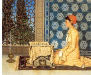
Resim 2.10: Osman Hamdi Bey. "Rahledeki Kız"